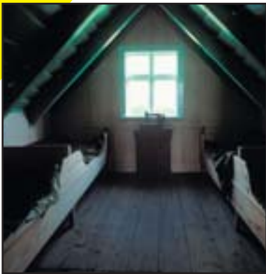
Wohnzimmer im Hof Sel